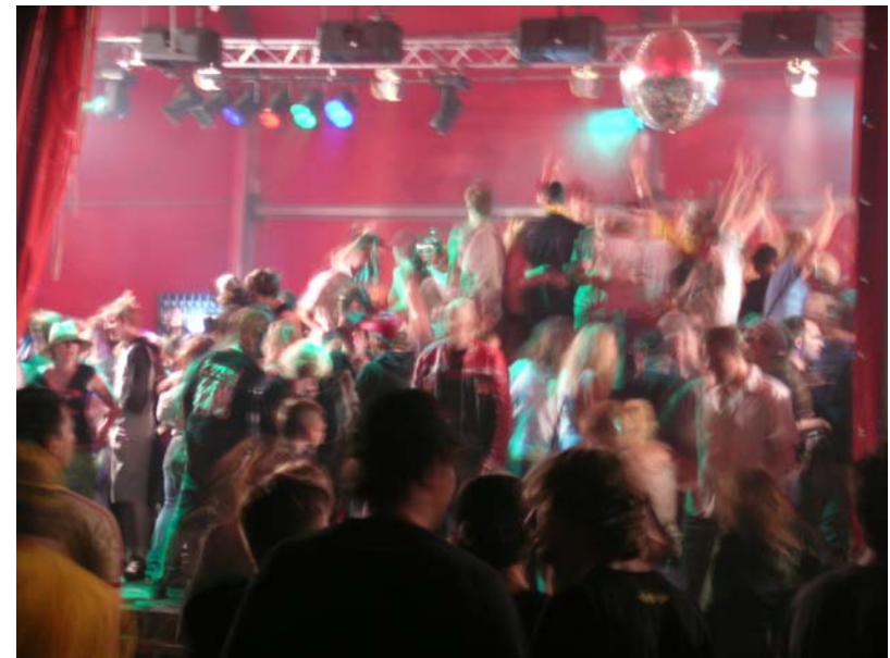
Das Thema Lärm erhielt am meisten Kommentare.

Zudem muss der Blog in anderen Blogs vermehrt verlinkt werden – allerdings müssen die Themen entsprechend spannend und nicht zu Basel-spezifisch sein. Und schliesslich sollten auch Mails weiterhin versandt werden – nicht zu oft, um den Effekt nicht abzunützen. Es wäre schön, wenn im Baudepartement die Mitarbeitenden sich etwas mehr auf dem Blog äussern würden. Ein viel kommentierter Beitrag wird auch von Aussenstehenden anders wahrgenommen.