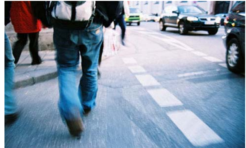
Das neue Bild als Einstieg zur Plattform auf www.aue.bs.ch

nen der Plattform weiterhin engagieren wird. Ausserdem entstand kürzlich ein Antrag 'Mobilitätsevent'. Er wird ebenfalls von einer Arbeitsgruppe zur Umsetzung vorbereitet.