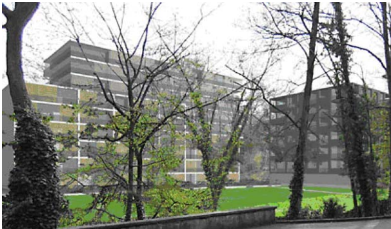
Studie der Überbauung Sevogelpark mit zwei Baukörpern.

Im Sevogelpark im Gellert-Quartier sind zwei weitere Vorzeigebauten der 2000-Watt-Gesellschaft geplant. Eines davon wird das erste MinergieP-Hochhaus der Schweiz sein.