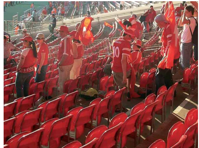
An der WM 06 ein Erfolg: saubere Stadien dank Abfallvermeidung

ben werden. Für Esswaren im Take away wird eine abfallarme Verpackung (System "pack ins Brot") vorgeschrieben. Die Massnahmen decken sich mit dem Nachhaltigkeitskonzept Österreich - Schweiz für die UEFA EURO 2008 und sollen in allen acht Host-Cities umgesetzt werden. In Basel ist zudem die Verteilung von Werbematerial bewilligungspflichtig und der Mitnahmeverkauf von Getränken in Glasbinden ist in Gebieten mit einer Hohen Dichte an Fussballfans verboten.