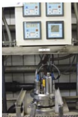
Messtopf für kontinuierliche Messungen