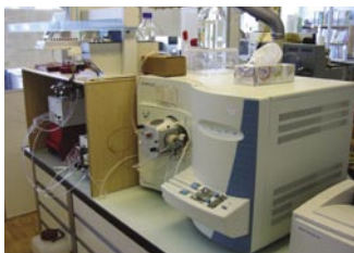
Labormessgerät zur Erfassung von Pharmawirkstoffen