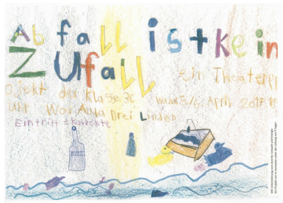
Bilder: Eindrücke von einer Zuschauerin aus der 1. Klasse

Die Kinder waren sehr interessiert am Thema „Littering“, dazu noch eigene Geschichten erfinden und Theater spielen, alle waren motiviert und beteiligten sich mit viel Energie am Projekt. Anfangs April waren die Aufführungen, die allen Beteiligten in guter Erinnerung bleiben werden und wie die Eindrücke der kleinen Zuschauer zeigen, mit nachhaltiger Wirkung.